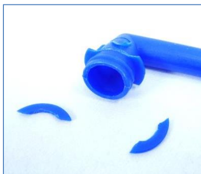
Abbildung 3: Abgebrochene Teile eines Spielzeugs, die vollständig in den „Schluckzylinder“ passen.

Ein Fahrzeug (mundbetätigtes Spielzeug für Kinder unter 3 Jahren) erfüllte nicht die Anforderungen des Abschnitts 5.1 b) der DIN EN 71-1. Bei der Schlagprüfung nach Abschnitt 8.7 der DIN EN 71-1 brachen Teile vom Spielzeug ab. Die abgelösten Teile passen vollständig in den Zylinder für kleine Teile („Schluckzylinder“) und gelten somit als verschluckbar.