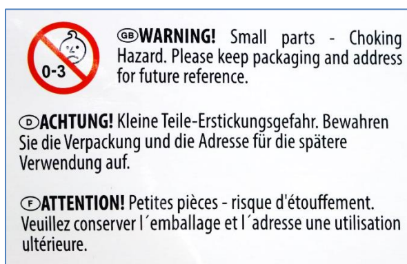
Abbildung 2: Typischer Alterswarnhinweis zu Kleinteilen.

Hinweis: Zum Zeitpunkt der Berichterstellung lagen die vollständigen Ergebnisse der Abfrage der Konformitätserklärungen und die Ergebnisse der Kennzeichnungsprüfung auf Grundlage der 2. ProdSV durch das Vollzugsdezernat des Regierungspräsidiums Darmstadt, Standort Wiesbaden noch nicht vor.