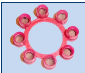
Abbildung 1: Amorces (8-Schuss Ringmunition) für Spielzeugpistole

Spielzeug mit Zündhütchen: Spielzeugpistolen, bei denen Schall durch das Abfeuern von Zündhütchen erzeugt wird.