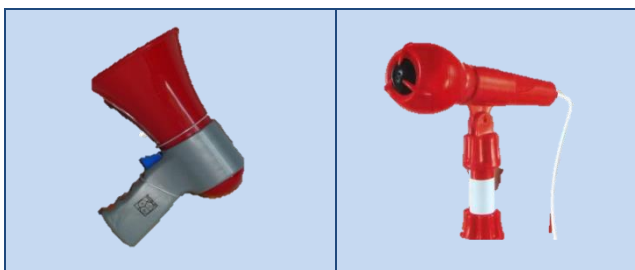
Abbildung 2: Produktbeispiele Megafon und Mikrofon

Mit der Stimme betätigtes Spielzeug: Spielzeug, bei dem durch eine elektronisch verstärkte oder verzerrte Stimme Schall erzeugt wird. Der Ausgangsschallpegel hängt dabei auch vom Eingangsschallpegel der Stimme ab z.B. Funksprechgeräte, Mikrofon, Megafon.